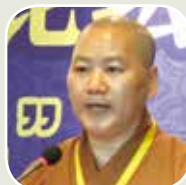
台灣中華佛教青年會理事長明毓法師