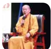
淨化社會文教基金會董事長淨耀法師