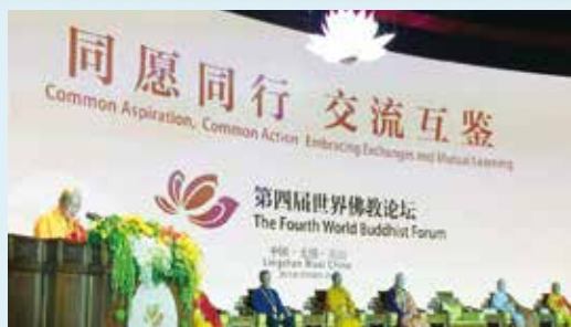
第四屆世界佛教論壇 在江蘇無錫舉行