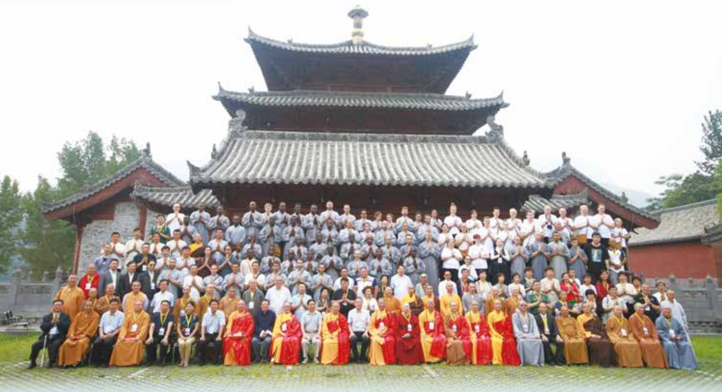
首屆海峽兩岸青年佛教論壇在河南嵩山少林寺舉行