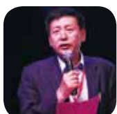
中國社科院世界宗教研究所黃夏年教授