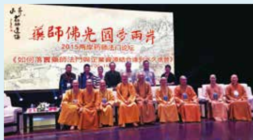
2015兩岸藥師法門論壇在浙江長興舉行