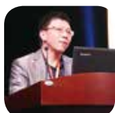
浙江省社科院哲學研究所所長陳永革教授