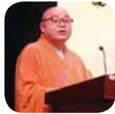
弘法法師講《藥師法門與企業管理》