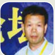
西北大學博士生導師李利安教授

辦，台灣中華佛教青年會、台灣中華佛教居士會、台灣中華豐財和合文化促進會共同支持舉辦。