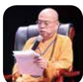
中國佛教會副理事長心茂法師