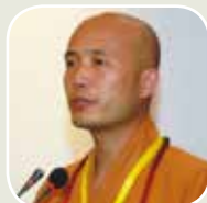
溫州佛教協會副會長達照法師