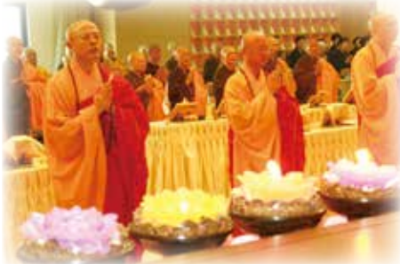
▲ 102 年燃燈報恩法會