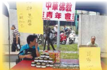
▲ 響應中秋敬老音樂餐宴園遊會