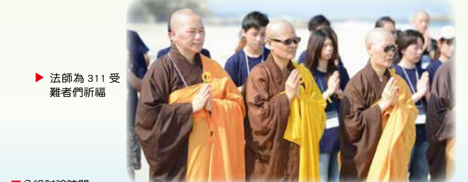
▶ 法師為 311 災難者們祈福

此次活動，除了結識這些來自各方的青年佛子，更讓我了解如何與大自然和平共存之道，而當中的慈悲與智慧，更是我們要致力去發掘與學習的——除了在現實層面上的顧及，我們還要探索更多關於自我心靈深處，能在遇到這些問題時，知道如何去應對，並且去接受它們！