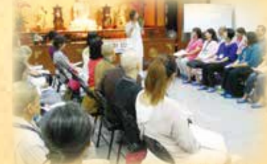
▲千手牽手與道同行志工培訓