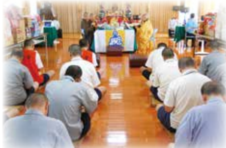
▲ 台北看守所中元普渡報恩法會