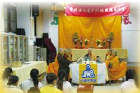
▲ 台北女子看守所地藏報恩法會