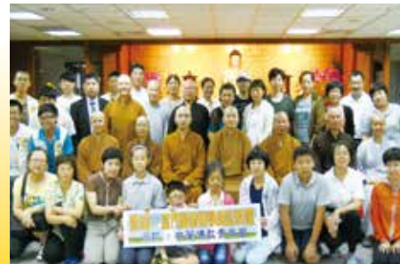
▲ 兩岸青年佛學交流 (廈門閩南佛學院訪問團)