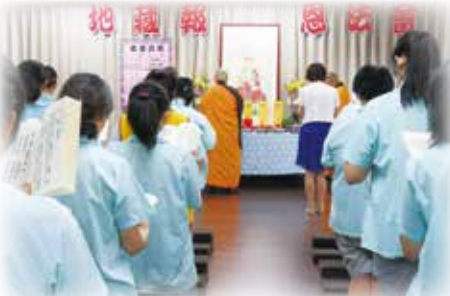
▲ 桃園女子監獄地藏報恩法會