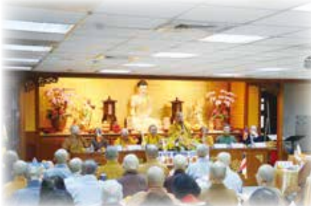
▲ 102 年新春團拜 - 貴賓致新春賀詞