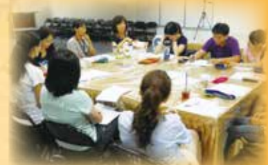
▲兒童夏令營志工老師培訓