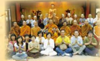
▲讚念長老開示內觀禪修