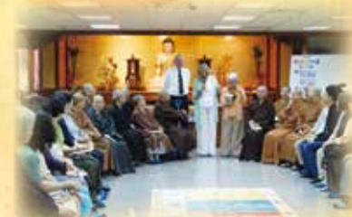
▲佛法與慈悲地圖工作坊 兩位美國博士帶領