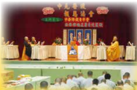
▲ 台北監獄中元普渡報恩法會