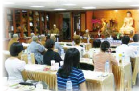
▲ 第八屆第二次會員代表大會