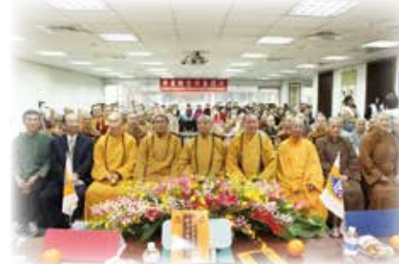
▲ 102 年新春團拜合影

中華佛教青年會於本會會館般若學苑開辦各項課程，提供一個學習、成長的場域外，也將持續關注著監獄以及校園的輔導演講，期以人間佛陀的精神服務社會，展現人文關懷之情。