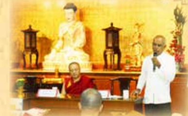
▲南北傳佛教融合論談-蘇瑪納教授