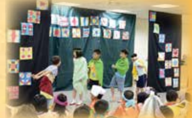
▲歡樂一夏~奇幻童話兒童藝術夏令營 戲劇演出