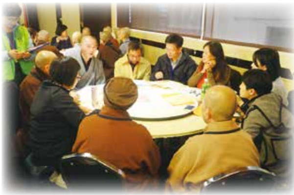
中佛青理事長帶領理事及秘書人員參與研討會活動

「道謝、道歉、道別、道愛」為原則讓病人放下內心的牽掛，最後能夠以純淨的心迎接死亡的來臨。