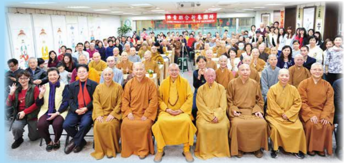
2017 年新春團拜大合照